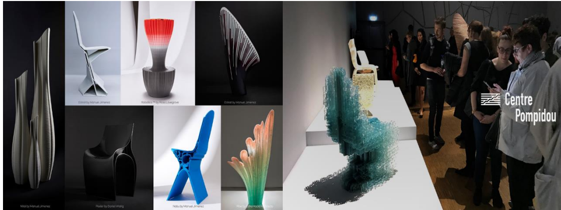
Muebles en 3D de Zaha Hadid Architects para Nagami

“Nos adentramos en una nueva era en la que la arquitectura y el diseño no sólo muestran una nueva expresión formal, sino también una conciencia por el diseño de métodos de construcción más eficientes y de reducción de costes que favorezcan un mayor acceso a la vivienda”.