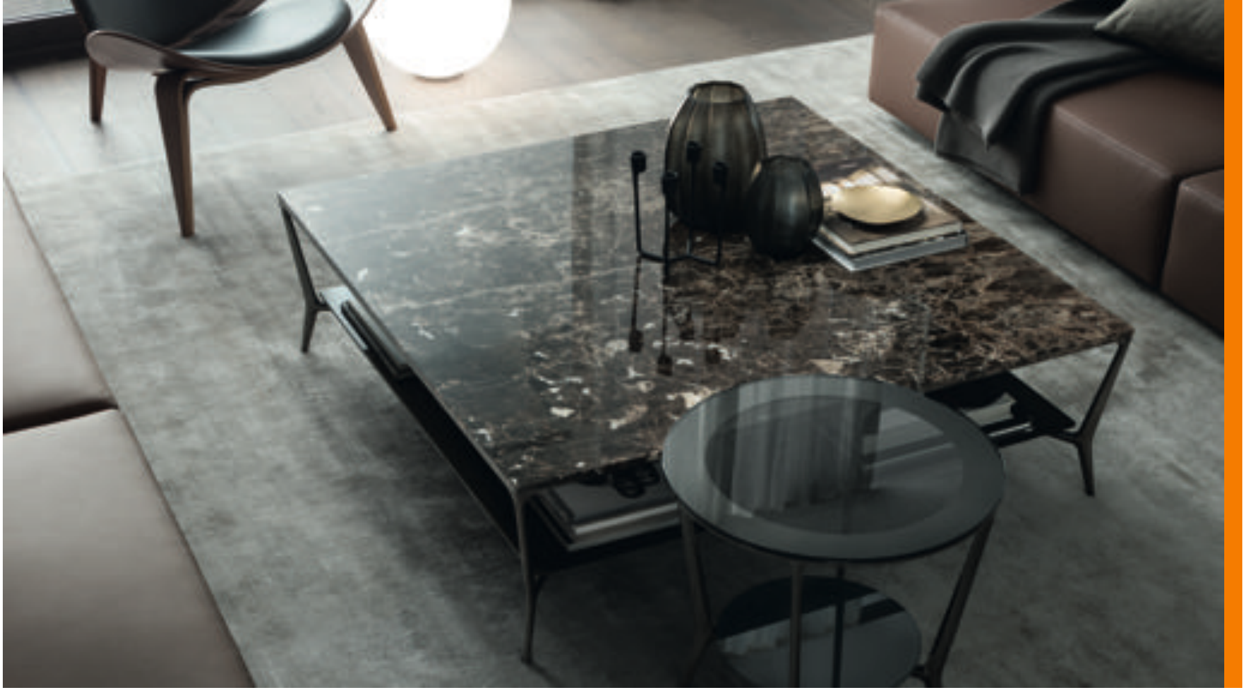
Mesa de mármol - Rimadesio

El peso que da la materia a un objeto es incuestionable. Una madera noble maciza es rotunda, un metal sobrio también, pero la piedra... la piedra es posiblemente la estrella de todas las materias. Y entre ellas el mármol es sin duda el rey.