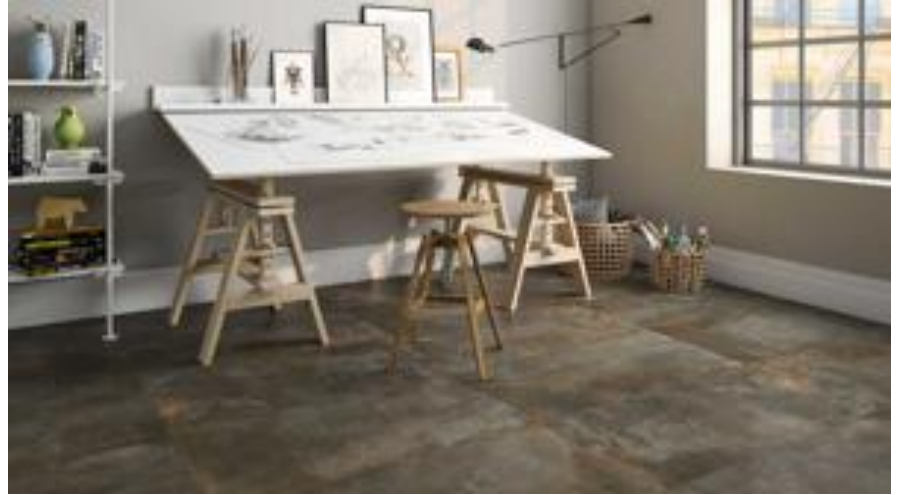
Suelos con un plus de estilo