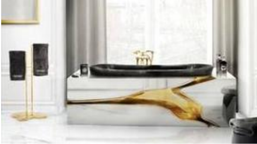
Baños con un plus de exclusividad