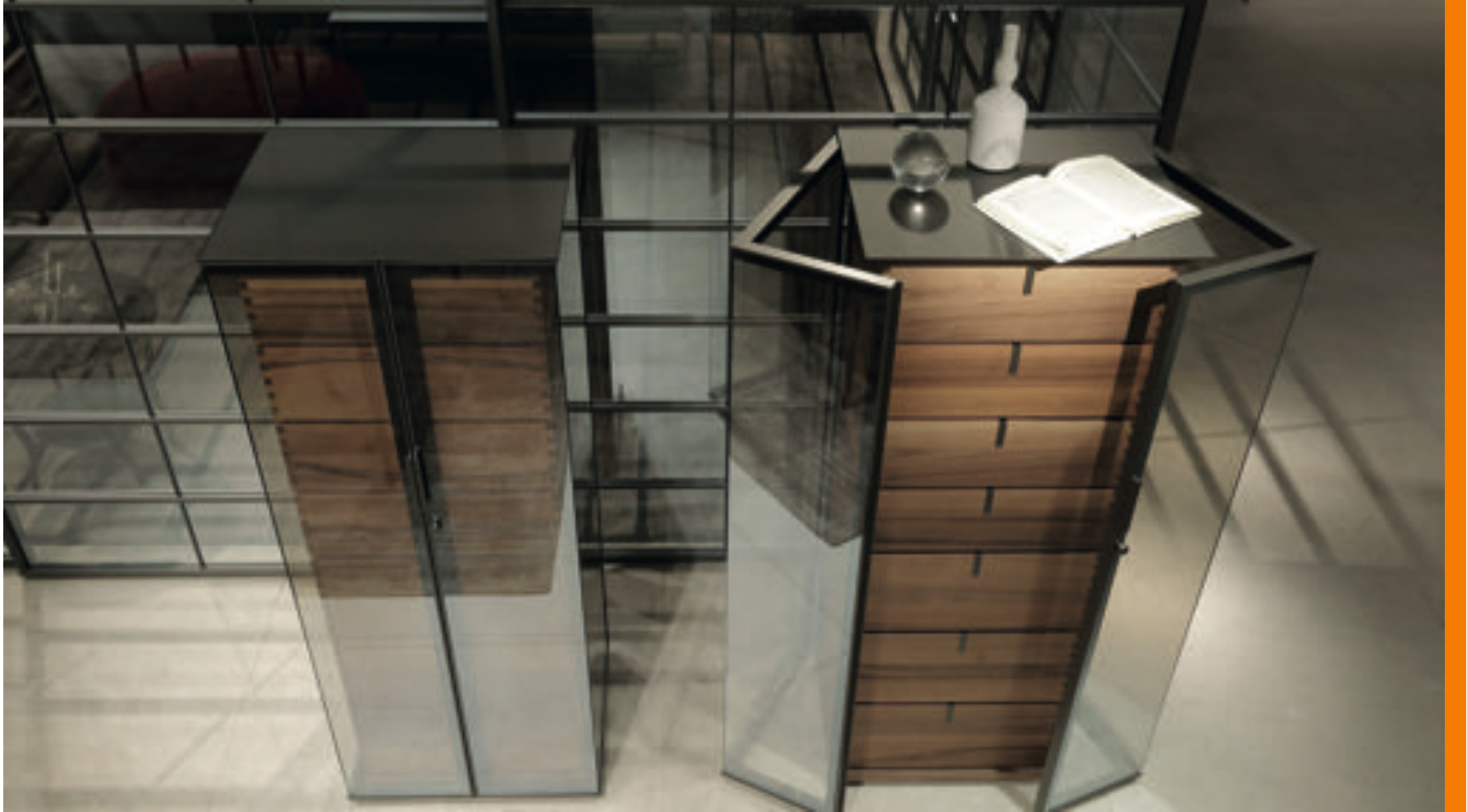
Modelo gabinete Ala - Rimadesio

Hay piezas que no pueden describirse de otro modo que como puro diseño . Estudiadas milimétricamente para ser únicas, ocuparán un lugar destacado en cualquier habitación.