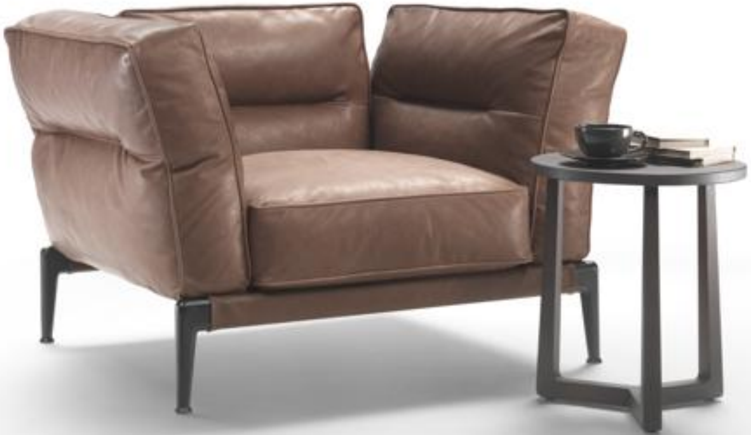
Butaca de piel - Flexform

En toda decoración que se precie siempre debe haber al menos uno o varios protagonistas que dirijan la atención y se conviertan en el "rey" del espacio.