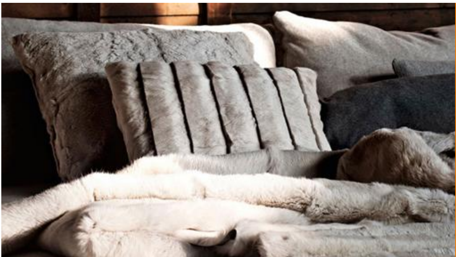
Mantas y cojines - Ivano Readelli

Quién no tiene en la retina la imagen de un sofá, frente al fuego, en el que tumbarse tapado por una manta suave y mullida. Probablemente sea una de las imágenes que más claramente se identifican con el confort de un hogar.