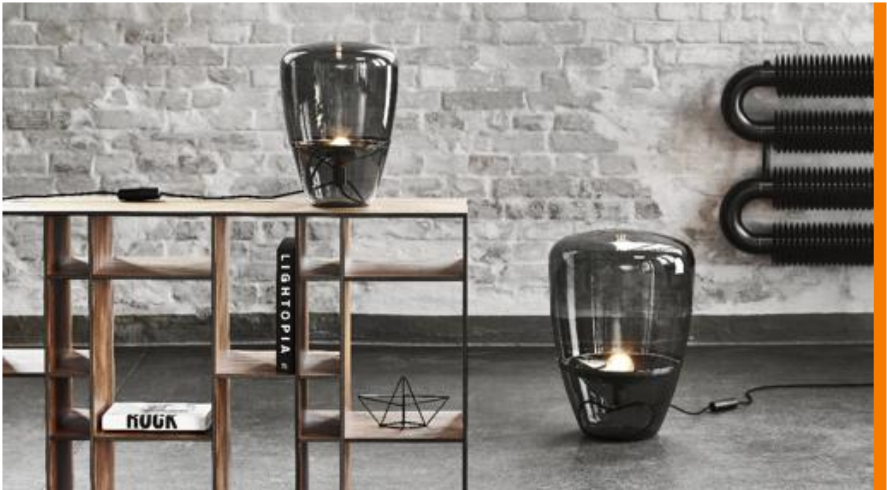
Lámpara Balloon - Brokis